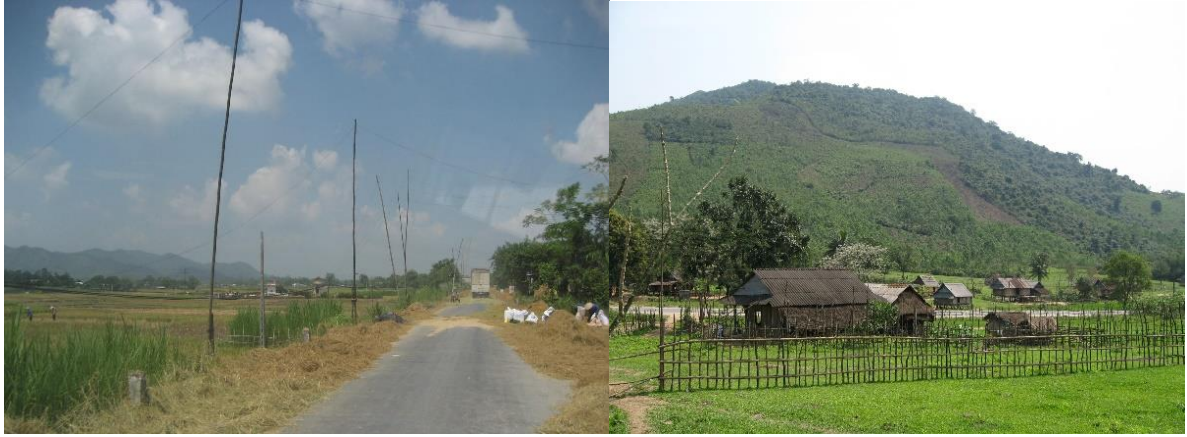
Hình 1.1: Nông thôn miền Trung