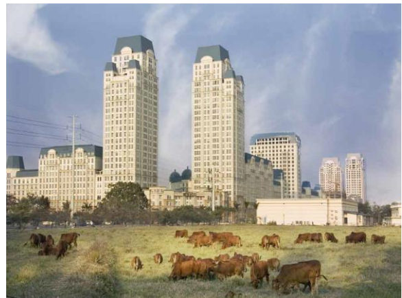
Hình 1.2: Nông thôn Việt Nam đang được đô thị hoá